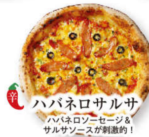
ハバネロサルサ ハバネロソーセージ & サルサソースが刺激的！