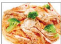
わたり蟹の Pasta アメリカソース