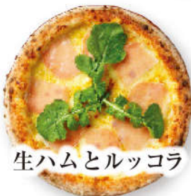
生ハムとルッコラ