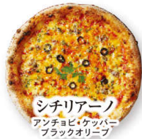
シチリアーノ アンチョビ・ケッパー ブラックオリーブ