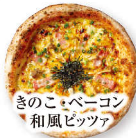
きのこ・ベーコン 和風ピッツァ