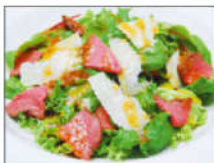
ローストビーフと バルミジャーノのサラダ