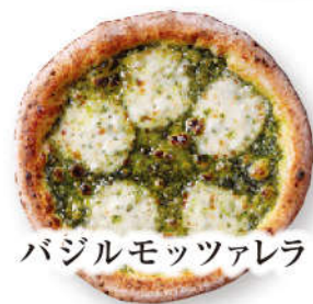
バジルモッツアレラ