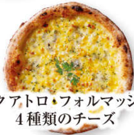
クアトロ・フォルマッジ 4種類のチーズ