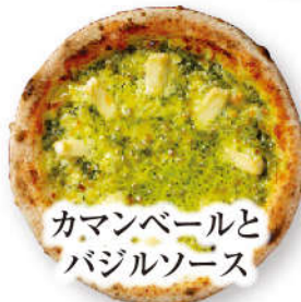
カマンベールと バジルソース