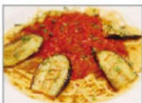
なすのミートソース