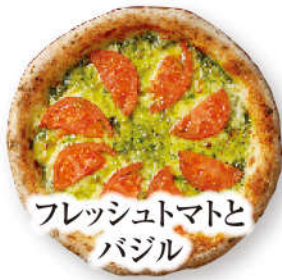
フレッシュトマトと バジル