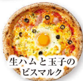
生ハムと玉子の ビスマルク