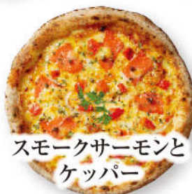
スモークサーモンと ケッパー