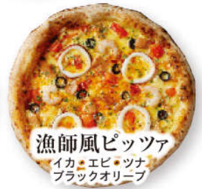
漁師風ピッツァ イカ・エビ・ツナ ブラックオリーブ