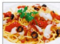
北海タコとドライトマトの ペペロンチーノ