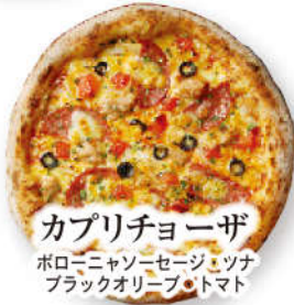
カプリチオーザ ポロミヤソーセージ・ツナ ブラックオリーブ・トマト