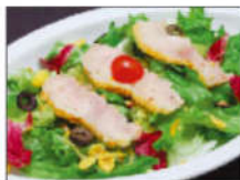
スモークチキンとナッツのサラダ