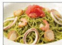
海の幸のジェノベーゼ